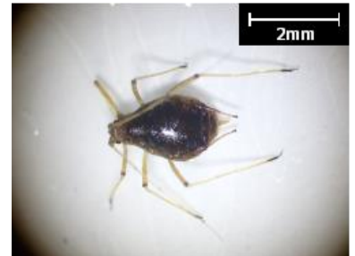
図 アブラムシ科 Aphididae

アブラムシ類は体長1~4mm程の昆虫で、日本では約700種が記録されています。体色は淡緑~濃緑、黄、赤、茶、黒、灰色などと幅広く、同一種でも翅の有る個体と無い個体が存在します。野菜や樹木、草花などに寄生し、植物の汁液を吸汁します。3~10月頃に発生し、雌は一日に数~十数匹の幼虫を産みます。多くの種類で、春~秋にかけて生まれる幼虫は全て雌で、10日程で成虫になり、未交尾で幼虫を産む事が出来るため、短期間で爆発的に個体数を増やします。